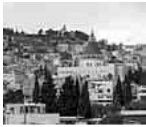
DAL NOSTRO INVIATO A NAZARETH MASSIMILIANO CASTELLANI

Sono trascorsi quattro anni dal Giubileo degli sportivi, quando il Santo Padre nell'anno Duemila dallo Stadio Olimpico di Roma